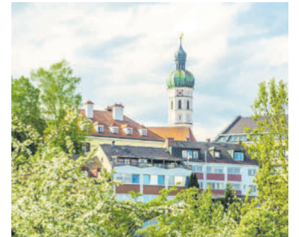
Dachau befindet sich nicht weit von der Radstrecke entfernt.

PAUSE An den Rastplätzen begeistern sich vor allem Kinder für die bunten, aber informativen Tafeln über das Leben des Räubers. Die Pausenstationen sind bestens ausgestattet, denn Tische und Bänke ermöglichen eine zünftige Brotzeit. Außerdem stehen teilweise E-Bike-Ladestationen und kostenlose Servicestationen zur Verfügung.