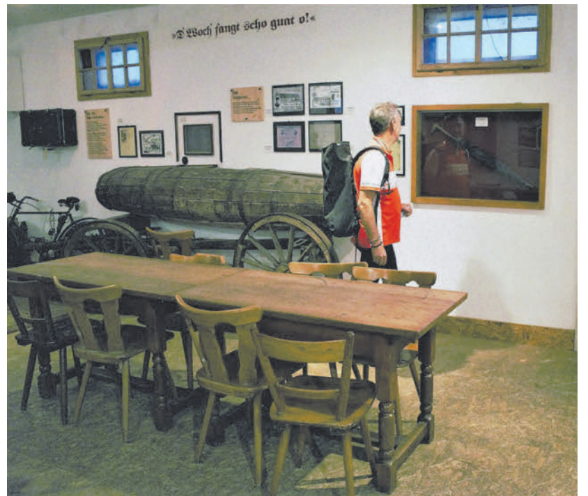
Im Keller des Maisacher Bräustüberls verstecken sich einige Schätze.

DACHAU Nur unweit der Radroute befindet sich das schöne Örtchen Dachau, das auf jeden Fall einen Abstecher lohnt. Im Herzen der Dachauer Altstadt befindet sich auch das Informationsbüro von Naherholung und Tourismus im Dachauer Land im charmanten alten Zollhäuschen, das allein schon sehenswert ist.