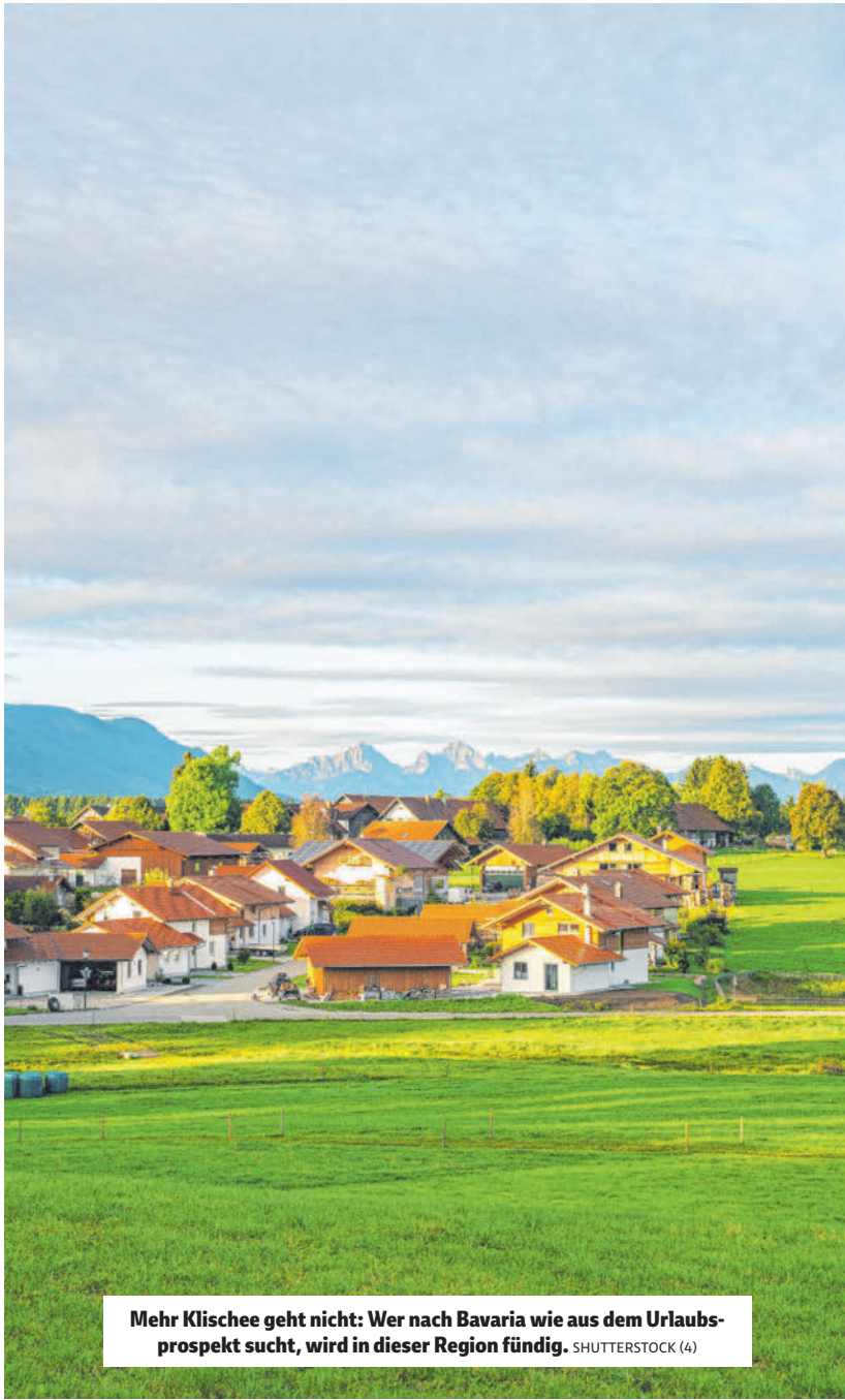
Mehr Klischee geht nicht: Wer nach Bavaria wie aus dem Urlaubsprospekt sucht, wird in dieser Region fündig.

FORTSETZUNG der Geschichte Auf Räuber Kneißls Spuren von Seite F1