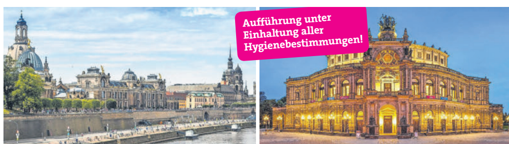
Aufführung unter Einhaltung aller Hygienebestimmungen!

MUSEUMSKELLER Bräustüberl Maisach: www.wirtshaus-maisach.de .