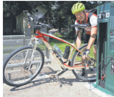
An den Rastplätzen findet man praktische Servicestationen. GERHARD VON KAPFF (SRT)

GERHARD VON KAPFF (SRT) reise@vn.at; 05572 501-467