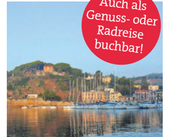
Auch als Genuss- oder Radreise buchbar!

Osten der Insel hat einiges zu bieten. In Rio nell'Elba starten Sie nach einem gemütlichen Cappuccino die schöne Wanderung nach Porto Azzurro. Nach Möglichkeit besuchen Sie eine kleine Mineralienmine, machen eine Weinverkostung etc. Im Bergdorf Capoliveri beginnen Sie eine Rundwanderung mit traumhaften Ausblicken aufs offene Meer und freuen sich auf ein Picknick. Den letzten Tag verplanen Sie nach Lust und Laune entweder am Strand